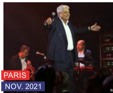
PARIS NOV. 2021