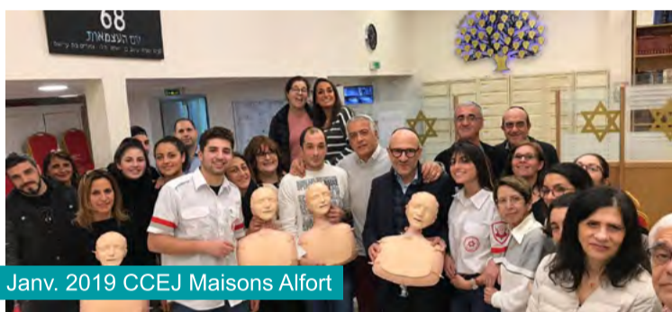
Janv. 2019 CCEJ Maisons Alfort